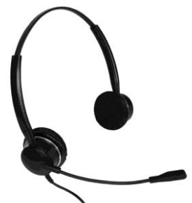
BusinessLine 3000 XD Flex

IFATCA Conference, Toronto, Canada 15. bis 19. Mai 2017 https://www.ifatca2017.com