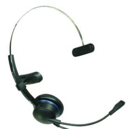
AirTalk 3000 XS Flex